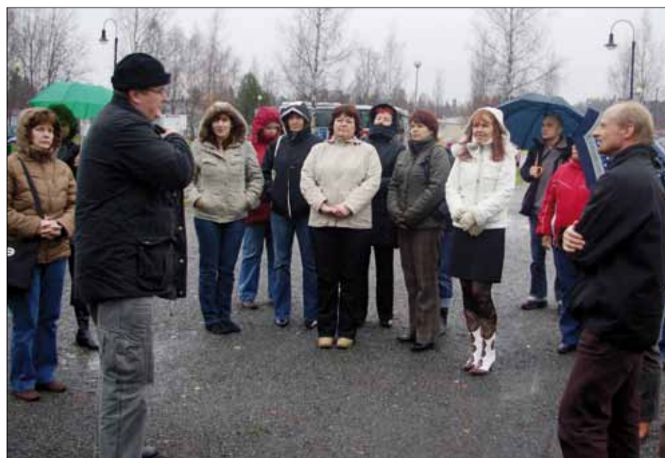
Arenduskoja liikmed tutvumas Vesilahde Ylämäel külakogukonna projektiga.