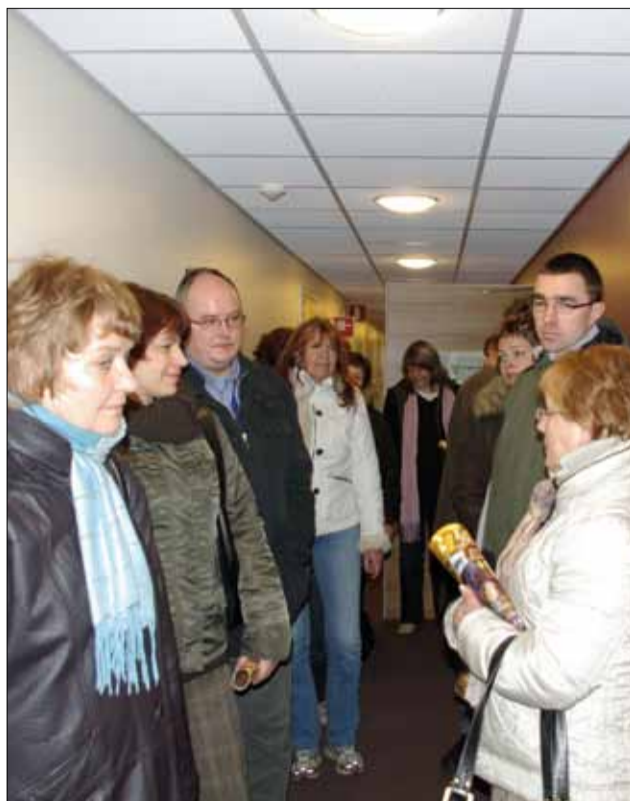
Soomes külastati ka Urjala vallas paiknevat Nuutajärve klaasitootmiskeskust.