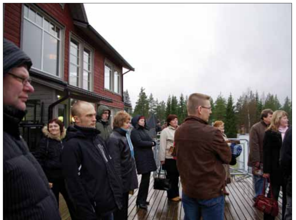
Sappe suusakeskuses nautis reisieltskond maalilist vaadet põhjamaiselt kaunile loodusele.