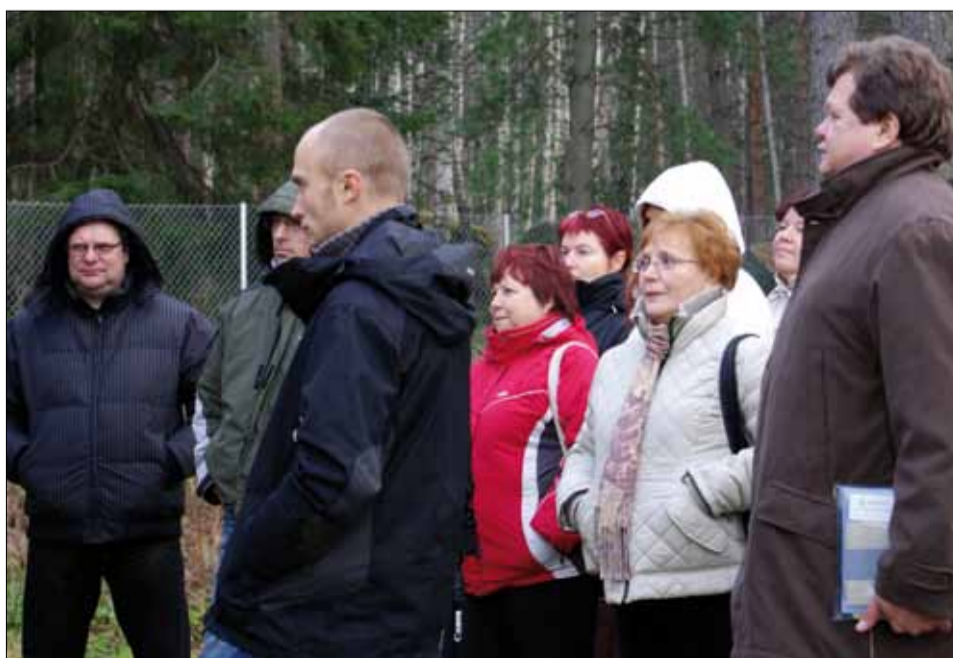
Arenduskoja liikmed tutvumas Tampere piirkonnas Mallasvee Sõudjate projektiga.