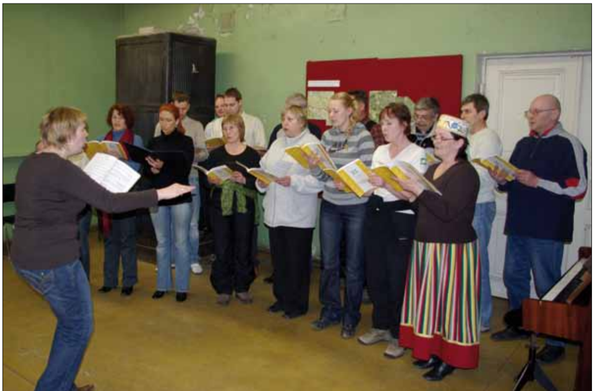
Vöhma seltsimaja pererahvas võttis külalisi vastu koorilaulu konsertiga.