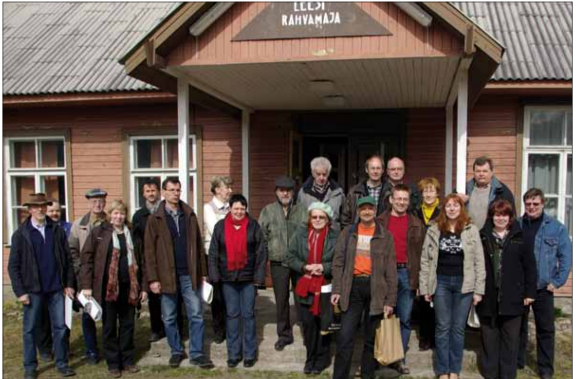
Leesi rahvamaja ees tegid külalised ja võõrustajad ühispidi.