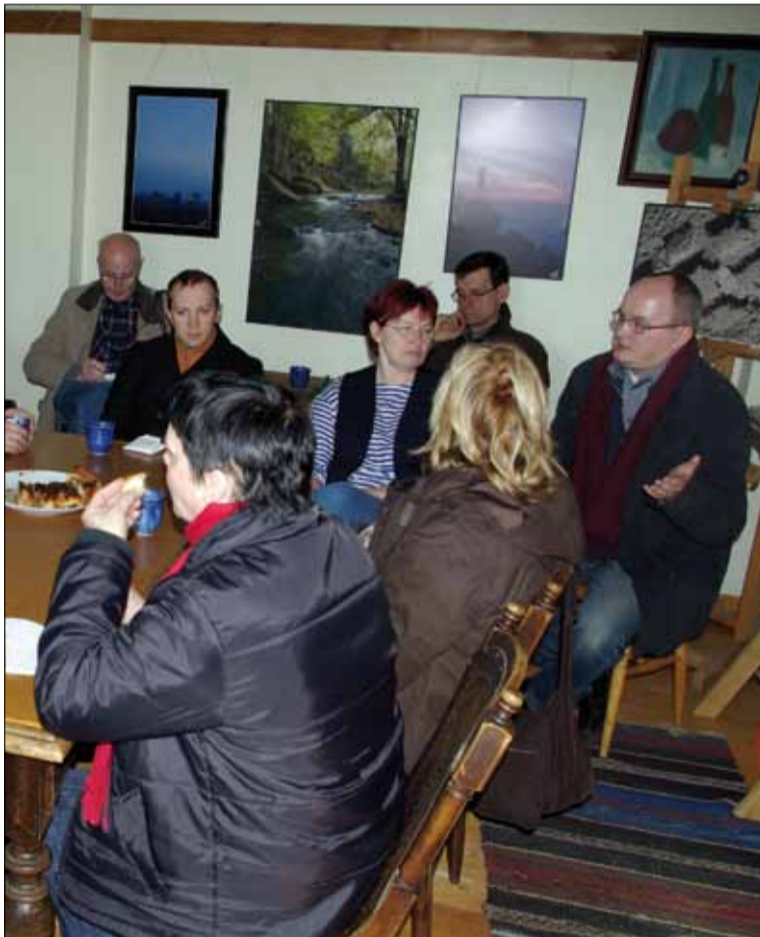
Käsmu meremuuseumis räägiti Käsmu külaseltsi tegemistest.