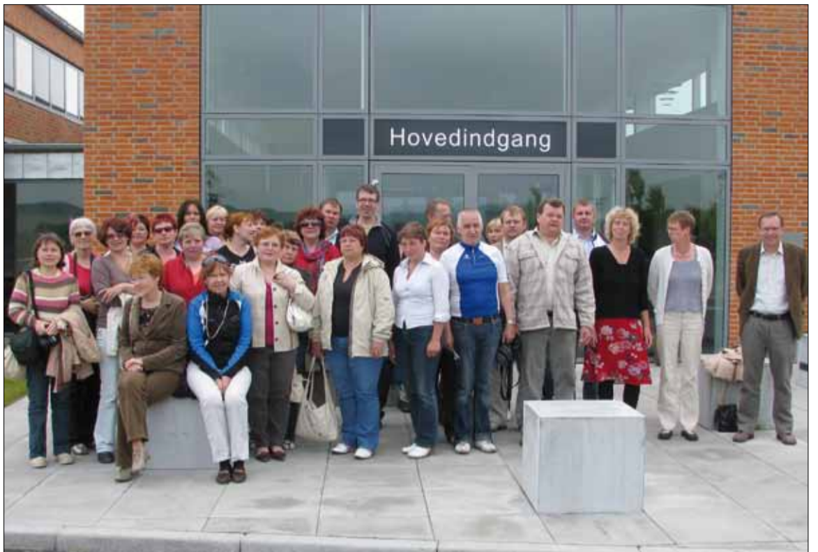
Arenduskoja delegatsioon koos võõrustajatega tegevusgrupi Djursland kontori ees.

Viimaseks külastatavaks projektiks oli väga suur ning huvitav masinate ja mootorite muuseum “Dansk Motorsamling”. Muuseumis oli vanaaegseid masinaid ja mootoreid, bensiinikanistreid, igasugu sorti liikumisvahendeid, eksponaatide hulk oli väga suur. Põnev asjaolu muuseumi juures oli see, et osa neist vanades