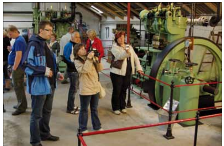
Taani masinate ja mootorite muuseumis „Dansk Motorsamling”.

Djurslandi tegevuspiirkonna juhatusse kuuluvad peamiselt eakamad inimesed, nooremad pole Leader-programmis eriti aktiivsed. Juhatusel esitab projekte tegevjuht, kes on käinud kohtadel ja tutvunud oludega. Kui juhatus esimesel koosolekul ei jõua otsusele, täpsustab tegevjuht andmeid ja arutatakse ka teisel korral. Kui projekt on seotud juhataja liikme tutvavatega, taandab ta ennast ot-