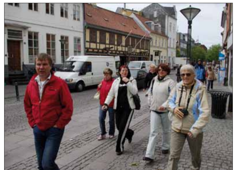
Tagasiteel külastati H.C. Anderseni sünnilinna Odensed.

Eesti tegevusgruppidel on esimene aasta rakendada oma strateegiaid, kuid oleme saanud