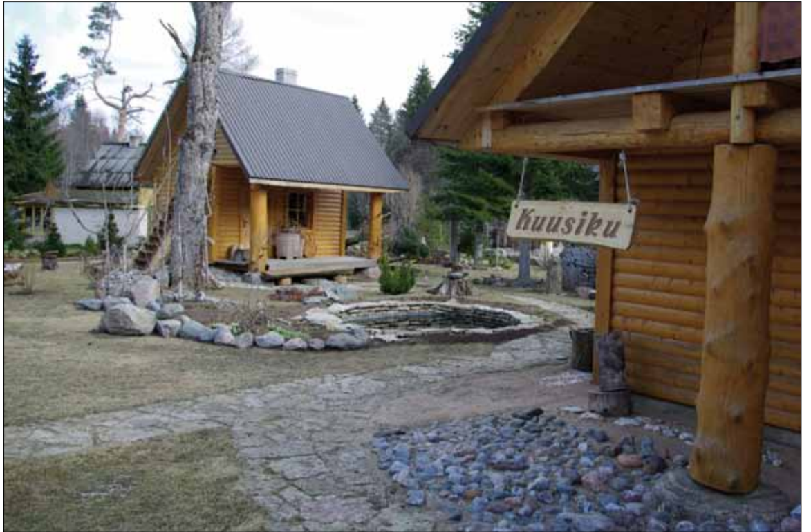
Kuusiku Loodustalus võib kogeda ehedaid elamusi.

matkaliste seltskonnale mõnus kohalik toit otse Kadrina lähikonnas asuva Madi Puhketalu vanas mõisaegses külastemajas, elamusteks suitsusauna ja matkamisvõimalused lähedal asuva Neeruti "mägedes", kauni kujundusega Metsaveere talu Jürimõisa külas karavani- või telkimisega puhkus eraldatud ja kõige vajalikuga varustatud puhkealal, hommikusöögi hulgas perenaise omavalmistatud küpsed ja salatid, Kuusiku Loodustalu ehedas keskkonnas mõnus puhkus või mitmekülgne ärikülastus, lisandiks erilise menüüga kohalik toit toas või looduses ja metsaretked, kaluriküla Altja südames asuvas Toomarahva turismitalu erinevad võimalused puhkuse veetmiseks koos eheda ja perenaise kaugemalgi tuntud erilise menüü (sh kalatoidud) nautimisega, Mätta ratsatalu Paasi külas Vihula lähisel üllatab omatehtud ahjusooja koduleiva ja kitsetoitudega (kasutades oma aiamaa saadused!) ning eriliste hobuste ja mitut liiki koduloomadega (isegi eeslipere), Adami turismitalu Väinupeal on mugavad võimalused privaatseks puhkuseks koos perenaise võrratute küpsed ja jõekäärus sõnajalgade varjus asuva suitsusauna mõnude nautimisega, sh kõik tingimused erivajadustega külastele, Arma ratsatalu Rutja rannakülas mitmekülgset võimalused ratsutamiseks, sh hipoteraapia teenused. Talu valmimas ehe samblase soojustusega palkpuhkejaja, Karepa ürdiaias võimalused ürtide ja ravimtaimedega tutvumiseks koos loodusravi terapeudist perenaise teadmistega, elamuseks väike maaligalerii, Toolse jõe ürgoru kaldal