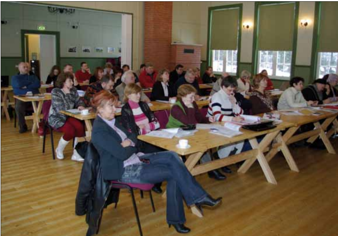
Kolgaküla rahvamajas oli kogunenud LEADER projektikirjutamise koolitusele saalitäis rahvast.