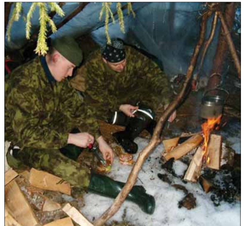
Ehedaid elamusi saab ka metsamatkal, kus õõbitakse okstest tehtud onnis ja valmistatakse higitel.

- koos messidel ja laadadel osalemine (Keskkonnatell, TourEst, Helsinki turismisõltused: "Eesti tuleb külla" päevad, Helsinki Mardilaat jm); - vahendajatele, partneritele ja huvilistele (ettevõtjad, üliõpilased) korraldatud teenuste tutvustus-/õppereisid 2005-2009; - ühistrükis korduvtrükisena eesti ja inglise keeles; - ühine turundusatribuutika: stend, logo, turunduslause: "Tule ja tunnetta ehedust", stiil müügitöös (n iga liikmel oma teenindus- rõivastus); - koostöövõrgustiku tutvustamine konverentsidel (n Jänedal 2007, Alatskivil 2009); - regulaarsed koosolekud/arendusõupidamised nõ külakorda erinevate liikmete juures, õppereisid ja koolitused liikmetele (retkejuhi koolitus, õppereisid teistesse