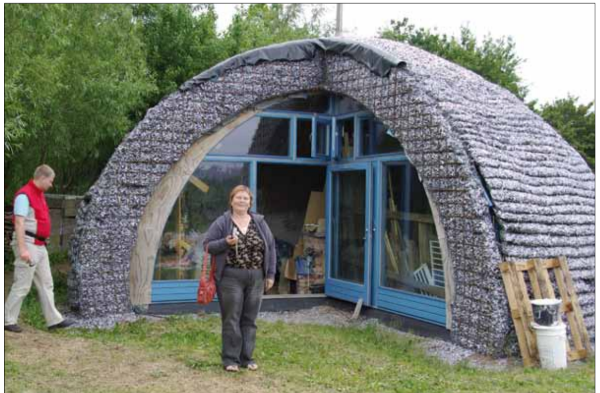
Vabalinnas Friland uudistati, kuidas on võimalik voorderada elamut merikarpidega.

küla tuleb kokku. Taanis võtsid koristustöödest osa eakamad elanikud, põhilise tegid ära palgatud töömehed.